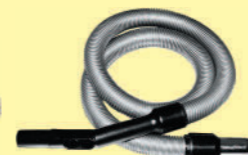
Saugschlauch Typ 3&5