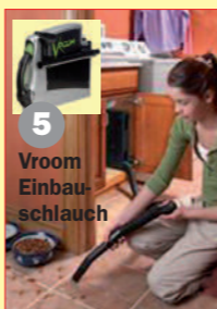
5 Vroom Einbau- schlauch